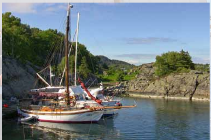
Idylliske uthavner finnes det mange av i Vestkystparken. There area many idyllic outports in the West Coast Park.

Coastal service offers assistance in the supervision of seabird reserve and other protected areas, cleanup of pollution and information to the public. Our Coastlines are under pressure, it is vulnerable, but has yet rich botanical values and a bird and wildlife that can provide beautiful scenery. Pay attention to other users, animals, birds and sensitive vegetation. You can read more about the Act, public rights and responsibilities we have as recreational users, online portal www.vestkystparken.no .