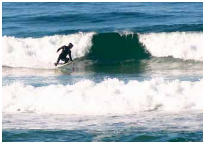
Surfing ved Borestranda, på Jæren.

Mer informasjon på www.vestkystparken.no