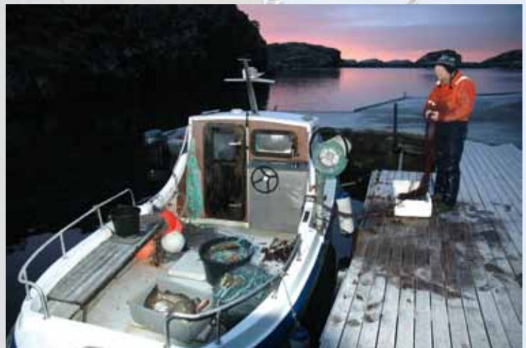
Vintertorsken er kommet! Fra Hissøyna i Fjell. The winter cod has arrived! From Hissøyna in the Fjell.

The West Coast Park is based on simple and environmentally friendly preparation, use and maintenance. Coastal service's personnel and boats ensures that areas are maintained and groomed so that they are always attractive to users. During the winter season it is performed maintenance and various arrangements, as setting up of new toilets, docks, signs, information boards, diving boards and walkways.