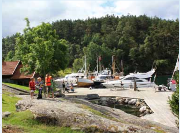
Livet på brygga, Romsa friluftsområde i Sunnhordland. Life on the pier, Romsa a spacious outdoor area Hardangerfjord.

More than 300 recreational areas are available along the west coast of Norway, from Egersund in the south to the border of Sogn and Fjordane in the north. Here is something for every taste. From well-adapted natural harbors with Wooden Jetties, grillhouses and spectacular outports. Most areas are accessible with mooring facilities.